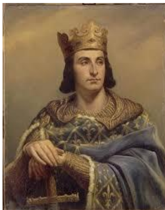
Re Luigi IX di Francia, detto anche San Luis

Infatti la nascita della Confrerie de la Chaîne des Rôtisseurs – Association Mondiale de la Gastronomie - risale al lontano medio evo viene fondata nell'A.D. 1248 ad opera del Re Luigi IX di Francia, detto anche San Luis, e ricostituita a seguire la seconda guerra mondiale nel 1950, ed a oggi conta oltre 80 Bailliage in tutto il mondo con una rete di 25mila associati. (per maggiori informazioni visitare il sito internazionale dell'associazione: www.chainedesrotisseurs.com ed il sito italiano dell'Associazione : www.chainedesrotisseurs.it ).