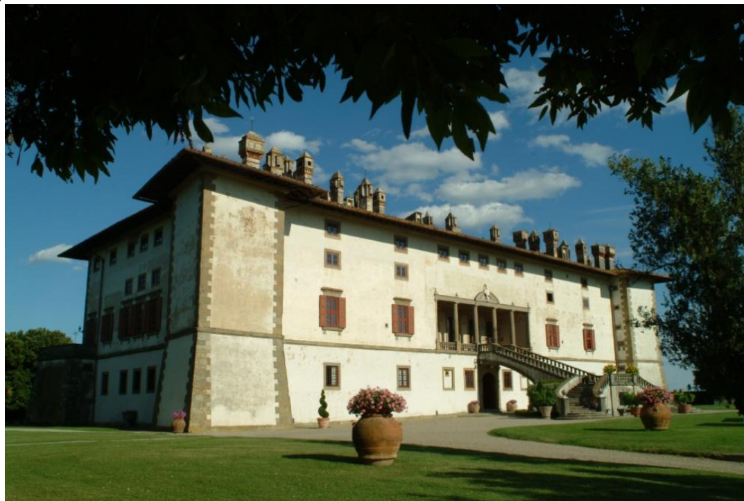
Villa Medicea La Ferdinanda

La Villa La Ferdinanda è anche la Sede di Rappresentanza ed operativa toscana del Bailliage Chaîne Toscana Francigena. (maggiori informazioni su www.artimino.com )