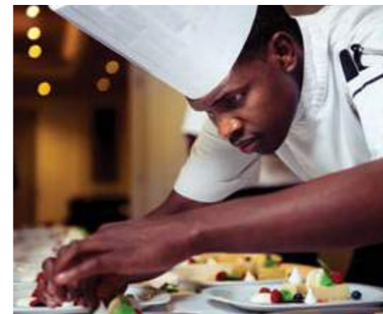
A fusion of European luxury and pan-African style.